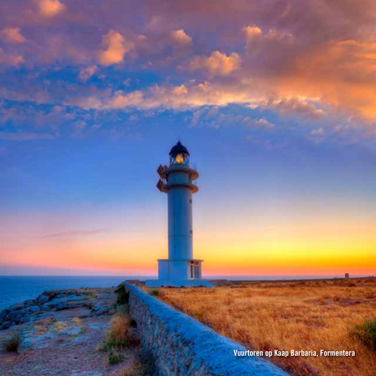
Vuurtoren op Kaap Barbaria, Formentera

Ondersteuning en advisering voor meer welzijns- en vitaliteitverbetering