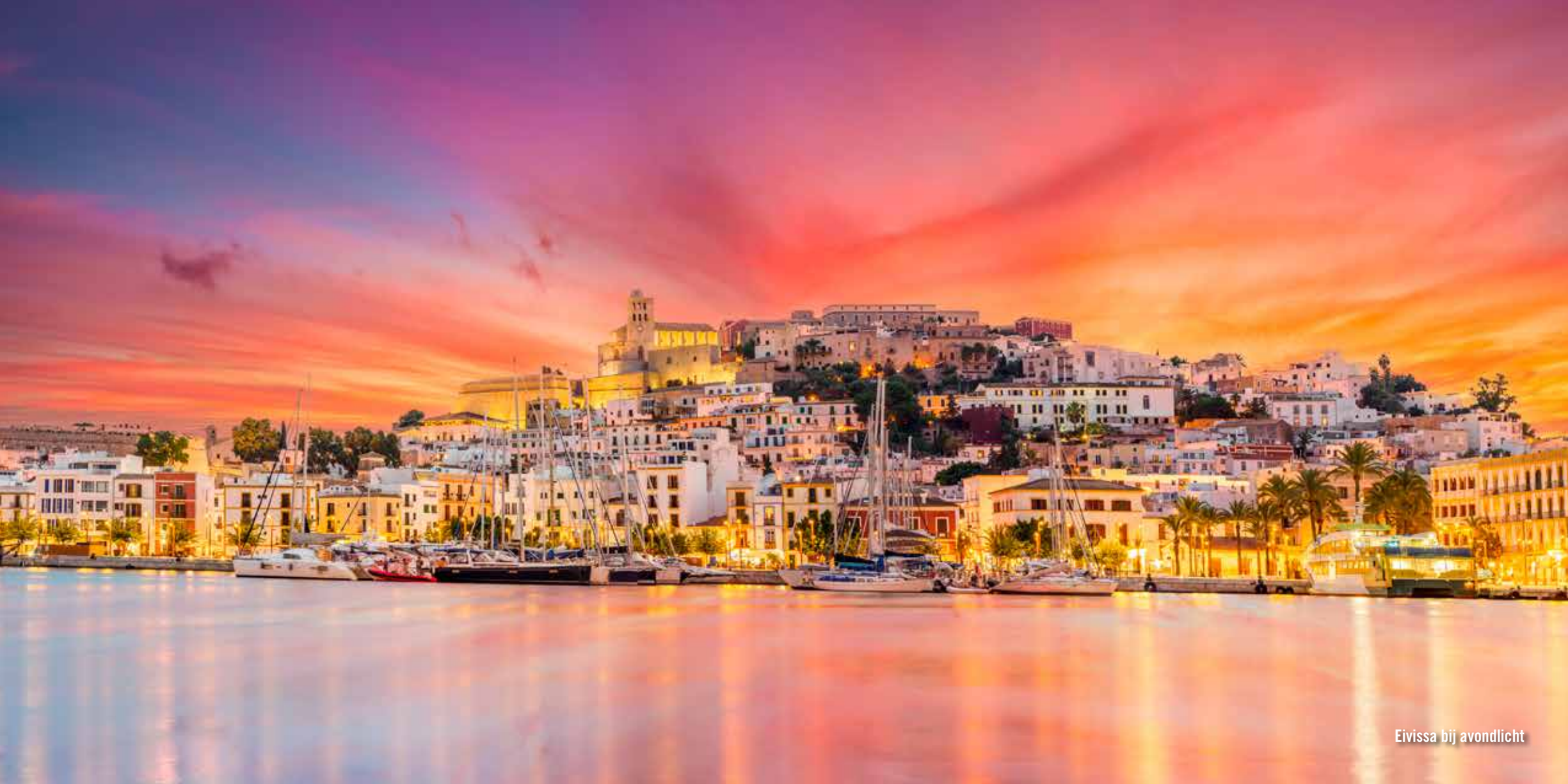
Eivissa bij avondlicht